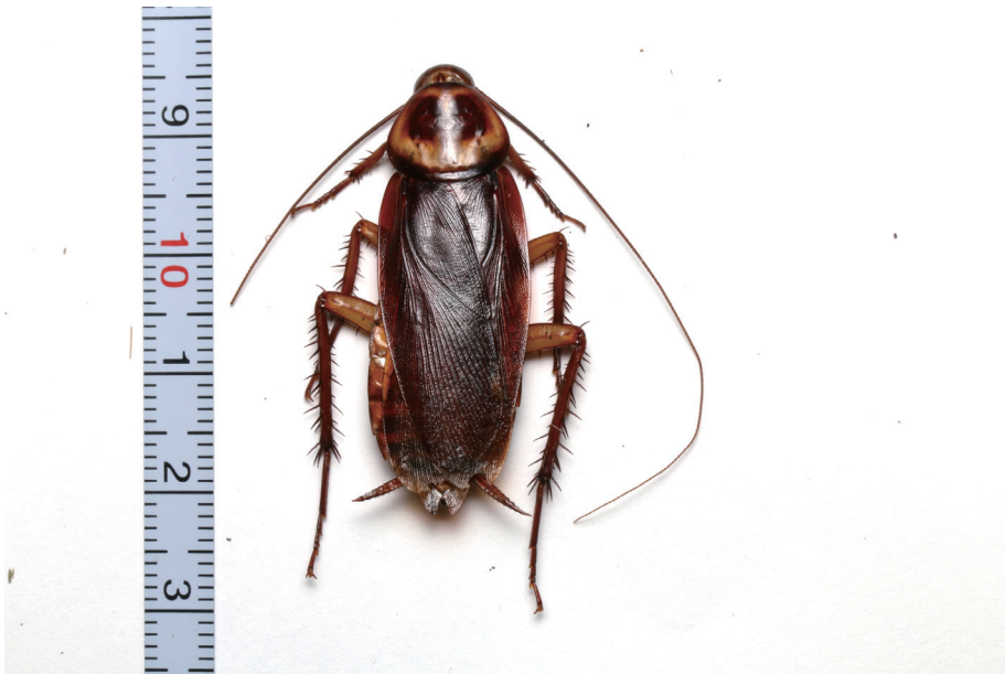
図 5 旧島で確認されたワモンゴキブリ

取られていない。西之島の最大の価値は、人為的影響のない原生の状態で遷移のプロセスが推移していくことにある。このため、可能な限り早く法的な根拠を持つ保護担保措置が図られることが望ましい。具体的には、原生自然環境保全地域や自然公園法上の特別保護地区などに指定し、立ち入りを制限することを検討すべきだろう。