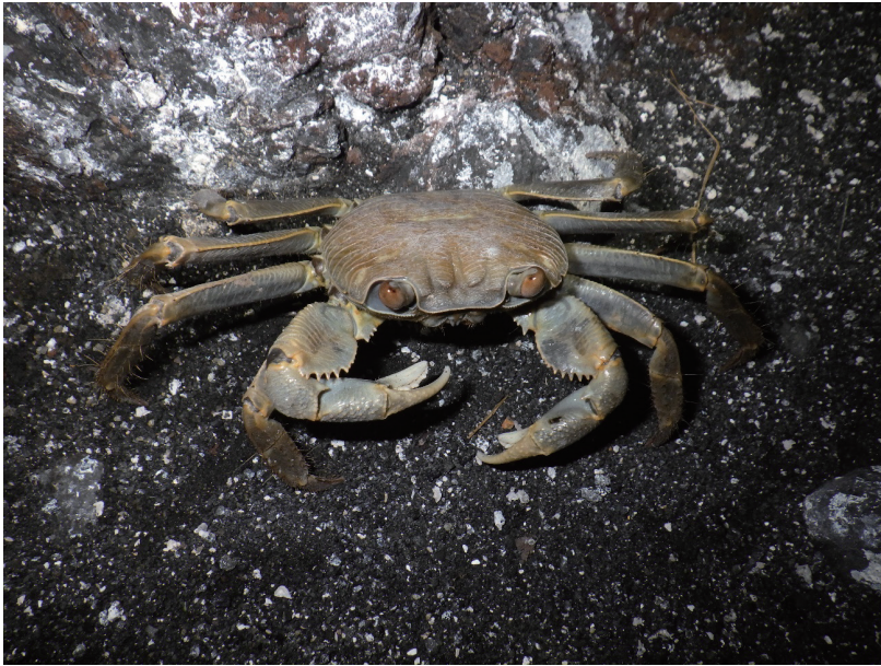
図 4 旧島で確認されたオオカクレイワガニ

の種が植物の生育していない場所から見つかることは珍しく、海鳥の死体を分解することで土壌生成に寄与している可能性があると考えられた。