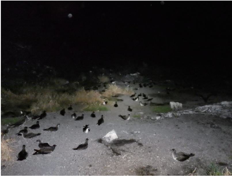
図 3 夜間に旧島に飛来した多数のオナガミズナギドリ

種は西之島初記録の種だった（森ほか、2020b）。これらの初記録の種は、噴火後に新たに定着したものではなく、過去に十分な節足動物調査が行われていなかったため未発見だっただけで、2013 年噴火以前から生息していたものと考えられる。海鳥繁殖地や海鳥の休息地では、岩の下から海鳥寄生性のクチビルカズキダニ Carios capensis が多数検出された。なお、今回の調査で発見された中には、外来種であるワモンゴキブリ Periplaneta americana も含まれている。一方で、噴火前の 2012 年に確認されていた 10 種の節足動物のうち 7 種は今回の調査では確認されなかった。その中には、トノサマバッタ Locusta migratoria のように体の大きいものやオオシワアリ Tetramorium bicarinatum のように一般に個体数が多い種も含まれており、噴火の影響により集団が消失した可能性がある。